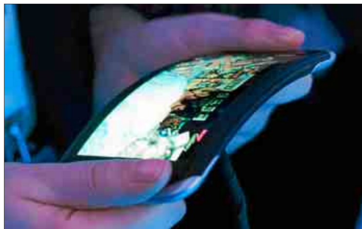
Prototipo de un teléfono móvil con pantalla flexible.

«Se trata de un teléfono con una pantalla construida usando grafeno como soporte, lo cual hace que sea flexible y resistente. Es un ejemplo perfecto de aplicación realizable con grafeno por su combinación única de propiedades: conductor,